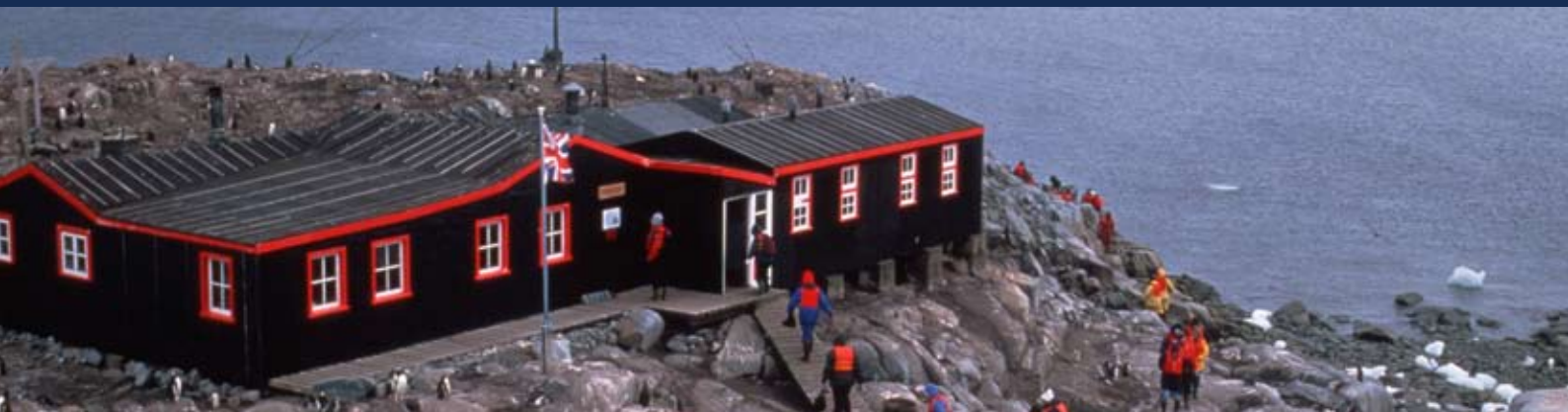
"Base A", Ile Goudier, Port Lockroy

64°49'S, 63°29'W – Située à port Lockroy du côté occidental de l'île Wiencke